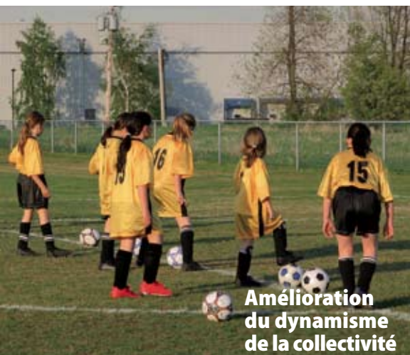
Amélioration du dynamisme de la collectivité

Une enquête a démontré que la présence d'arbres et d'espaces verts dans un quartier commercial exerce une influence positive sur les attitudes des consommateurs et sur les prix qu'ils sont prêts à payer dans les entreprises locales.