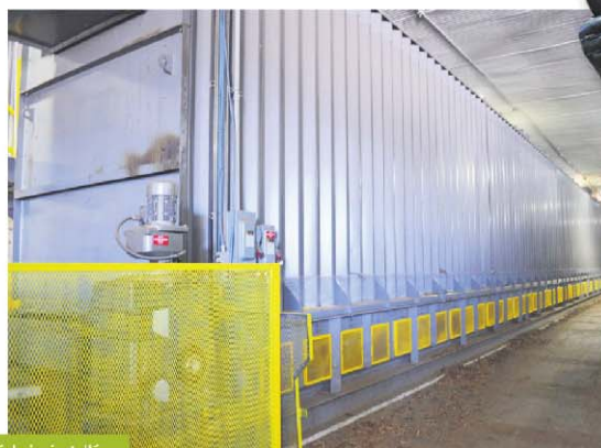
L'un des bioséchoirs installés à Saint-Patrice-de-Beaurivage.